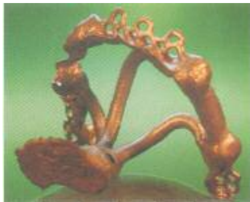
Abb. 31: Die ebenmäßigen Oberflächen sind nur geringfügig auszuarbeiten.