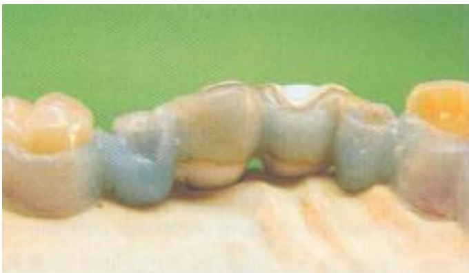
Abb. 26: Das Lichtwachs kann angeknetet oder mit dem elektrischen Wachsmesser aufmodelliert werden.

Nachdem die Galvanoteile auf die Zirkoniumdioxidgeschiebeflächen aufgesetzt worden sind, haben wir die restlichen Zähne wieder in die Modellsituation zurückgeführt (Abb. 24). Somit sind wir in der Lage, einen modellgussartigen Modellationsbereich direkt auf dem Meistermodell ohne die Notwendigkeit zur Verstellung eines Duplikatmodells vorzufinden. Beim Modellieren an die Zahnaufstellung und die palatinalen Zahnhälse heran, erhalten wir Rückenschutzplatten und Kragenfassungen (Abb. 25) durch das direkte Adaptieren des Metacons auf die Wachflächen bzw. Kunststoffzähne (Abb. 26). Über die galvanisierten Strukturen werden die Wachplatten gedrückt und so perfekt und fest auf der Oberfläche adaptiert. Die für eine Vollverblendung vorgesehene tertiäre Struktur im Bereich der Teleskope sowie des Steges kann so modellationstechnisch innerhalb von Minuten hergestellt werden (Abb. 27). Ebenso verfahren wir mit dem Kronenblock, der durch die Rillen-Schulter-Fräsuren sowie das mesiale und distale Preci