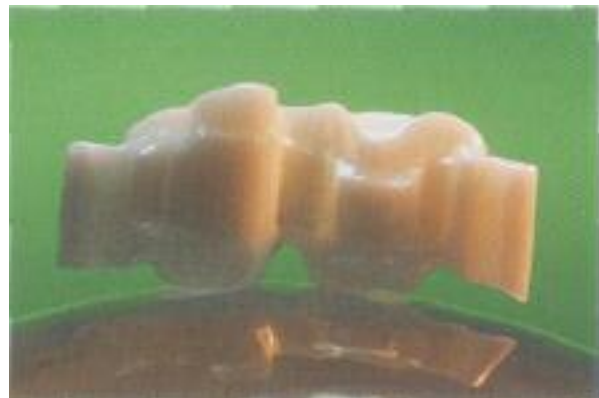
Abb. 18: Der fertig gefräste Kronenblock hat nun hochglänzende Geschleifflächen.