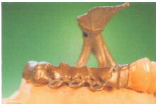
Abb. 33: Die Cercon Kronen sind schon keramisch verblendet.

Einbetten, Gießen, Ausbetten und Aufsetzen auf die Galvanostruktur sind ohne große