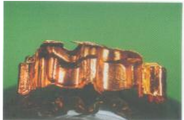
Abb. 22: Die Innenflächen der Galvanos weisen eine hochglänzende Oberfläche auf.

Rahmen und der manuellen Nacharbeit im Sinterofen ca. 7 Stunden (so lange dauert der Aufheiz-, Halte- und Abkühlungsprozess) gesintert.