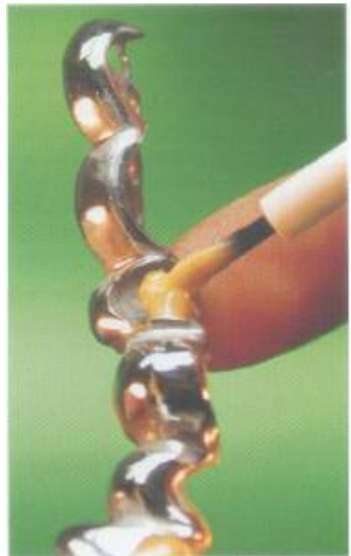
Abb. 40: Der Kleber ist auf beide zu verklebenden Teile aufzubringen.