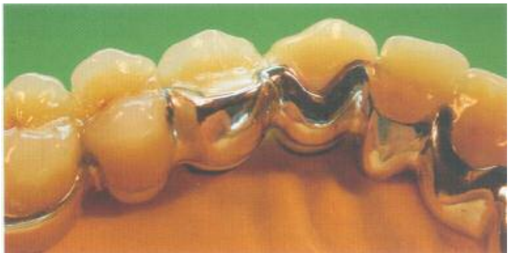
Abb. 43: Durch das Voll-wax-up bei der Planung der Arbeit fügen sich alle Strukturen zu einer anatomischen Zahnform zusammen.