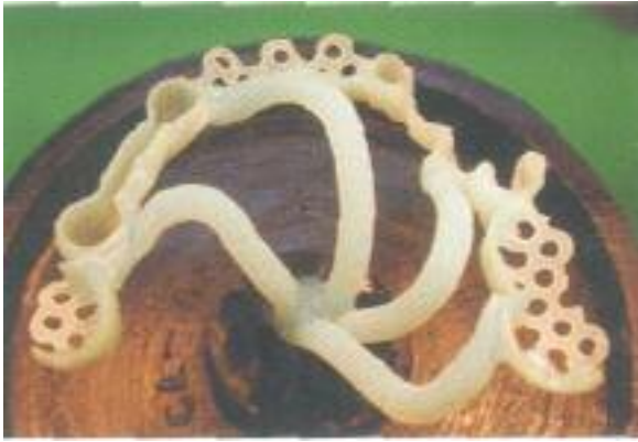
Abb. 29: Die angestiftete Modellation des „Modellgusses“, der kein Modellguss ist.