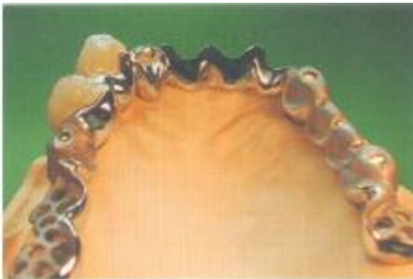
Abb. 37: Kontrolle der Metallstrukturen vor der Verklebung auf dem Meistermodell.