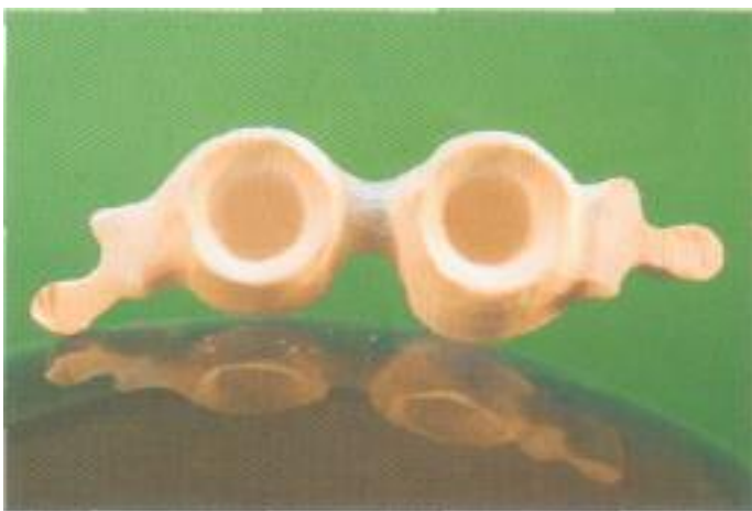
Abb. 11: Die Basalflächen überzeugen durch kaum sichtbare Schliffspuren.

direkt an die lichthärtende Modellierwachsstruktur angesetzt werden (Abb. 7).