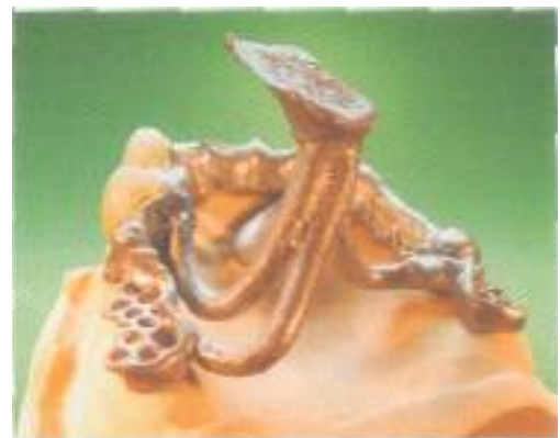
Abb. 32: Das erste Aufsetzen auf das Modell ohne Korrektur der Passung.

Vertex-Geschiebe ergänzt worden ist (Abb. 28), indem wir diesen Anteil aus dem lichthärtenden Wachs modellieren. Die Gesamtmodellation einer solchen Modellgussituation dauert ca. 90 Minuten, eingerechnet der Zeit bis zur Phase, wo die Modellation mit Gusskanälen zum Einbetten vorbereitet wird (Abb. 29).