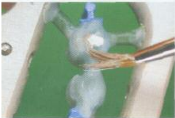
Abb. 9: Beschichtung der im Scannrahmen eingesetzten Modellation mit Silberpuder.