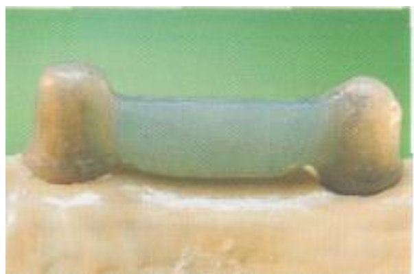
Abb. 13: Das Lichtwachs lässt sich gut mit dem Ergebnis sehr glatter Oberflächen verarbeiten.