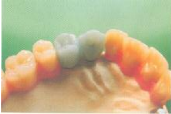
Abb. 5: Das Voll-Wax-up zur Planung der Fräsungen und Platzierung der Geschiebeteile.