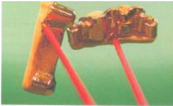
Abb. 21: Nach dem Galvanisiervorgang muss der Gips mit Gipslöser entfernt werden.