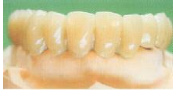
Abb. 42: Die Ansicht von frontal in ästhetischer Weise überzeugt. Die Kunststoffverblendungen harmonisieren mit denen aus Keramik.

miker hat bei der Herstellung von Kronen und Brücken aus Zirkoniumdioxid nicht das Problem, schwarze oder graue Oxide abdecken zu müssen, sondern kann aufgrund der weißen Unterbaufläche eine schöne und harmonische Gestaltung der Farbe auch im zirkulären Randbereich erzielen.