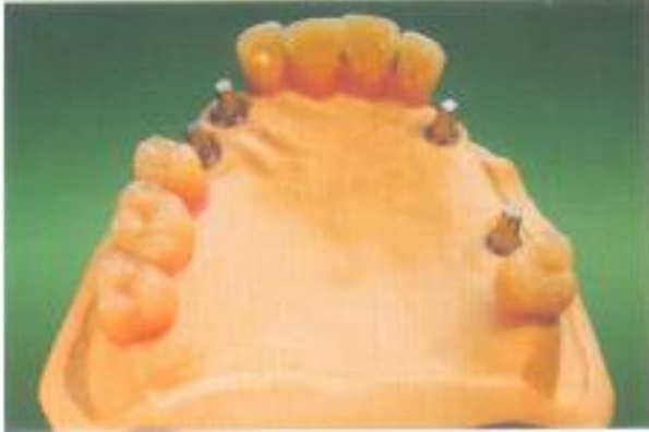
Abb. 1: Die Ausgangssituation: Auf der Basis von vier Implantaten soll eine abnehmbare Brückenkonstruktion gestaltet werden.