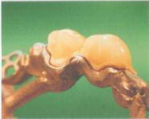
Abb. 35: Perfekte Geschiebepassung schon vor dem Ausarbeiten.