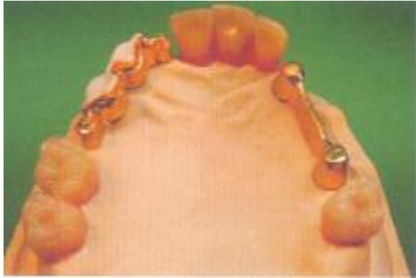
Abb. 24: Nach Aufsetzen der Galvanoteile kann der Modellguss modelliert werden.