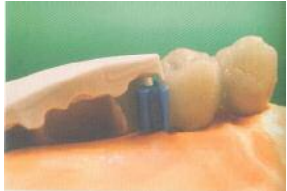
Abb. 6: Die Geschiebepatrize wird nach Einschubrichtung angesetzt und höhenkontrolliert.

Aufstellung den Patienten, den Behandler und den Zahntechniker zufrieden stellen. Ergibt die kritische Bewertung des Gesamteindrucks ein positives Ergebnis, übertragen wir mit einem Silikonschlüssel diese Aufstellung auf das Meistermodell. Sämtliche fehlenden Zähne, die nicht durch eine Mesiostruktur mit den Implantataufbauten in Verbindung stehen, werden auf das Meistermodell übertragen und stellen die tatsächlich zu ersetzenden Zahnanteile dar. Nun