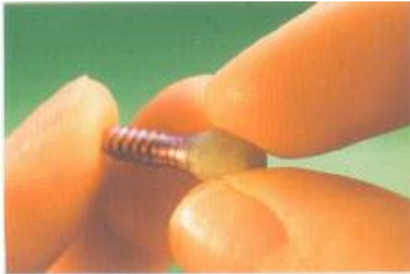
Abb. 3: Die Kronenkäppchen werden aus dem lichthärtenden Wachs Metacon auf das Manipulierimplantat geknetet.