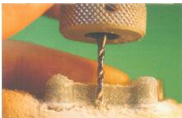
Abb. 12: Die Stegmodellation aus lichthärtendem Wachs wird im Fräsgesetz bearbeitet.

Der vollautomatische Fräsvorgang kann nicht beeinflusst werden. Diese gefräste Kronenstruktur wird vorsichtig von den anmodellierten Haltearmen, an denen sie sich