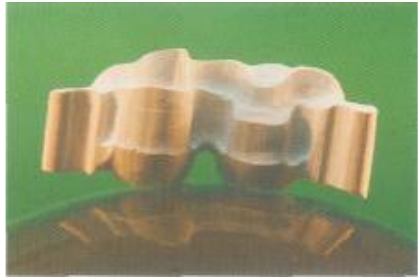
Abb. 10: Die gefräste Struktur wurde mit rotierenden Instrumenten beschliffen.