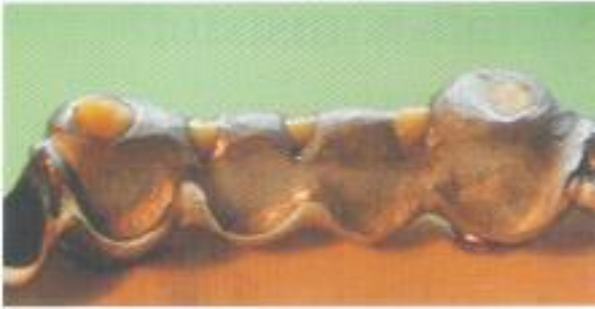
Abb. 41: Durch kleine okklusale Aussparungen im Modellguss kann der überschüssige Klebstoff beim Aufsetzen herausfließen.