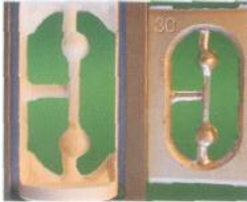
Abb. 14: Die gefräste Struktur ist um ca. 30 % größer als die Modellation.