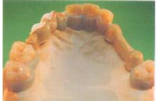
Abb. 25: Das Anmodellieren der Rückenschutzplatten an die aufgestellten Zähne.

gold auf den Dublierstümpfen abgeschieden. Nach dem Herauslösen der Epoxydharzanteile oder dem Auflösen von gipsartigen Untergrundstrukturen (Abb. 21) erhalten wir eine Galvanoplastik mit einer perfekt wiedergegebenen Geschiebeinnenfläche (Abb. 22). Nur noch das Kürzen der übergalvanisierten Ränder ist notwendig, um einen einwandfreien Sitz der Sekundärstruktur herzustellen (Abb. 23). Es sind keinerlei Formkorrekturen an den Geschieben notwendig.