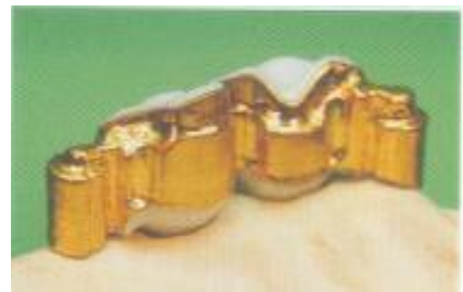
Abb. 23: Einwandfreier Sitz der Sekundärstruktur nach Randkorrektur.

charakter (Abb. 18). Über ein Dublierungsverfahren werden diese Kronenblöcke in ein Duplikat übertragen (Abb. 19) und die zu galvanisierenden Anteile mit Leitsilber elektrisch leitfähig gemacht (Abb. 20). Die Kupferelektroden werden nach Herstellerangaben (je nach Gerätesystem leicht unterschiedlich) für die galvanische Abscheidung vorbereitet und Geschiebeflächen aus Fein-