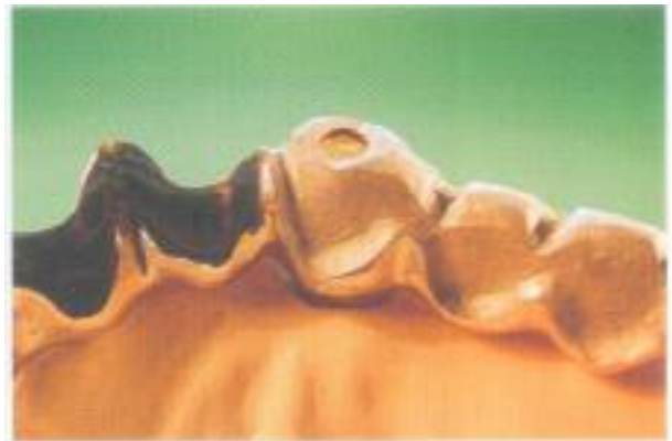
Abb. 38: Minimaler Klebespalt. Okklusal die Öffnung für den Abfluss des Klebers.

Formkorrekturen möglich (Abb. 30 und 31). Ein nahezu perfektes Ergebnis ist schon beim ersten Aufpassen auf das Meistermodell festzustellen (Abb. 32). In der Zwischenzeit sind die Zirkoniumdioxid-Kronen keramisch verblendet worden (Abb. 33). Hierfür sind die Keramikmassen Vita VM 9 (VITA Zahnfabrik, Rad Säckingen), verwendet worden, die einen hervorragenden Farbaufbau für die weiße Untergrundfläche gewährleisten. Der Kera-