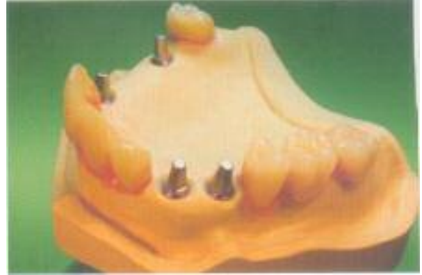
Abb. 2: Eine Aufstellung gibt erste Anhaltspunkte über die zukünftige Zahnstellung und die zu schaffenden Freiräume im Mund.