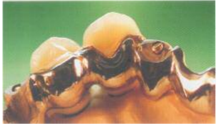
Abb. 36: Die Cr-Co-Mo-Legierung wird wie gewohnt ausgearbeitet und poliert.