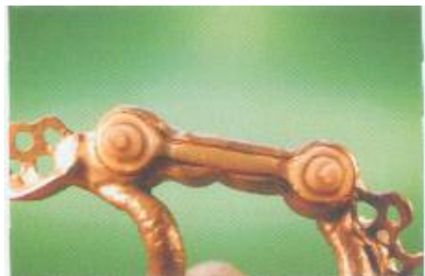
Abb. 34: Eine vielschichtige Passung: Cercon, Galvano und Cr-Co-Mo.