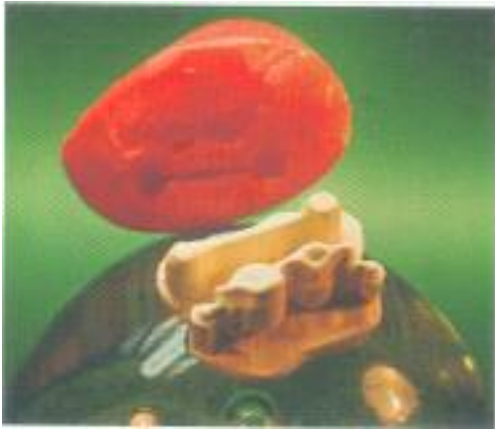
Abb. 19: Für das Galvanisieren werden Duplikatmodelle aus Gips gefertigt.