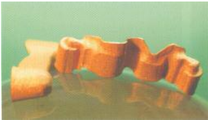
Abb. 39: Vorbereitung der Galvanos mit Aluminiumoxid und Rocatec vor dem Verkleben.

Formkorrekturen möglich (Abb. 30 und 31). Ein nahezu perfektes Ergebnis ist schon beim ersten Aufpassen auf das Meistermodell festzustellen (Abb. 32). In der Zwischenzeit sind die Zirkoniumdioxid-Kronen keramisch verblendet worden (Abb. 33). Hierfür sind die Keramikmassen Vita VM 9 (VITA Zahnfabrik, Rad Säckingen), verwendet worden, die einen hervorragenden Farbaufbau für die weiße Untergrundfläche gewährleisten. Der Kera-