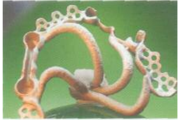
Abb. 30: Der Gus nach dem Ausbetten.