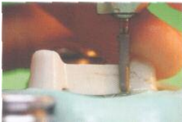
Abb. 17: Das Beschleifen des Zirkonoxids erfolgt mit einer wassergekühlten Turbine.

wird auf diese Wachsstrukturen im Spray-on-Verfahren eine gleichmäßig hauchdünne Silberlackschicht aufgebracht. Dieser Auftrag liegt im \mu\text{m} -Bereich und beeinflusst die Passgenauigkeit nicht. Auch im zirkulären Randbereich werden die Strukturen nicht verändert, weil keine Oberflächenberührung durch Pinsel oder andere beschichtende Instrumente stattfindet. Nach dem Einsetzen in den Rahmen (Abb. 14) und dem Scannen erkennt man die vergrößerte Wiedergabe des ausgefrästen Rohlings. Diese Strukturen werden nach dem Herauslösen aus dem